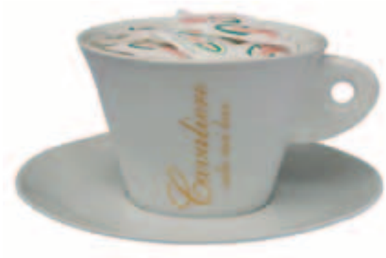
Serie Avorio Portazzucchero