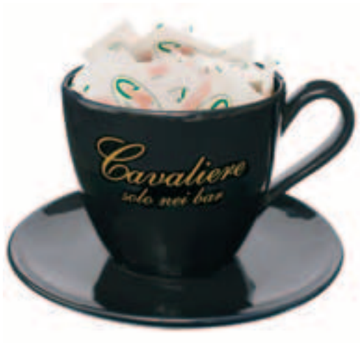
Serie Nera Portazzucchero