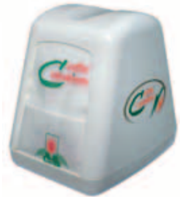
Portatovaglioli Napkin holder