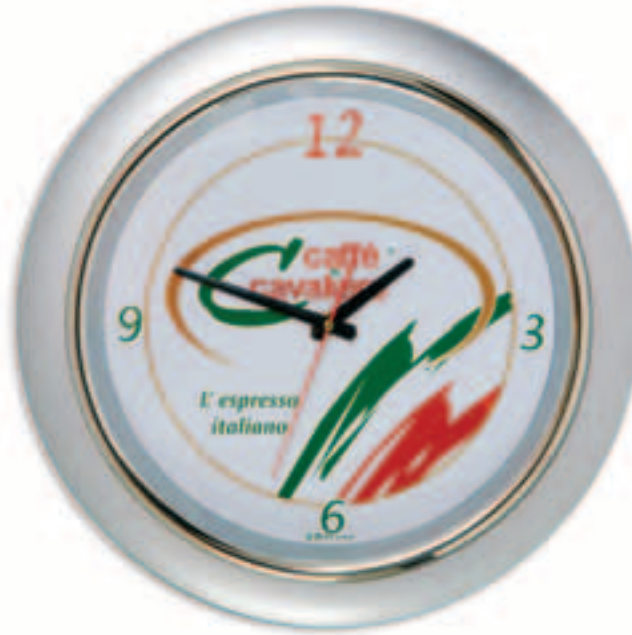
Orologio da parete diametro cm. 42 Colori: argento, marrone