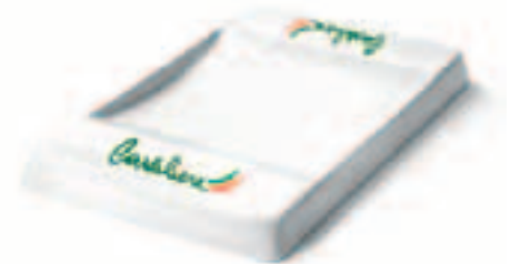
Rendiresto Change tray