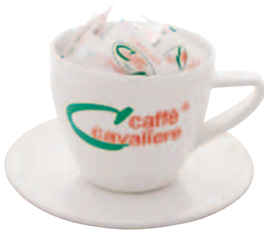
Serie Bianca Portazzucchero